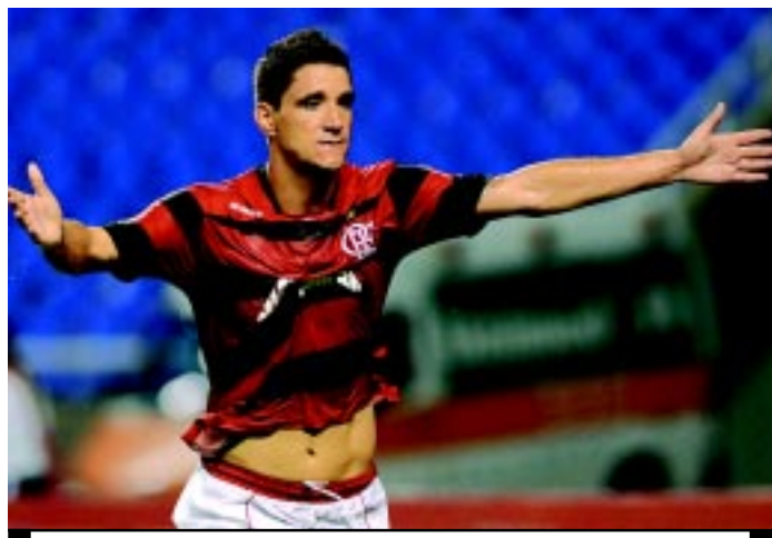
Thiago Neves deve voltar a fazer dupla com Ronaldinho Gaúcho

Se por um lado Luxemburgo comemora a volta de Thiago Neves, por outro ele tem problemas na defesa. Alex Silva se contundiu contra o Vasco e não tem data