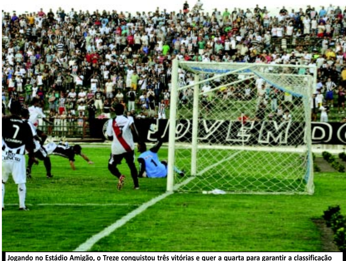
Jogando no Estádio Amigão, o Treze conquistou três vitórias e quer a quarta para garantir a classificação