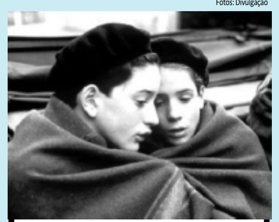
Cena do longa-metragem Adeus, Meninos, de Louis Malle

>>> ADEUS, MENINOS - Sem 1944, na França ocupada pelos nazistas, uma escola católica esconde alunos judeus. O garoto Julien Quentin vê com desconfiança a chegada do introvertido Jean Bonnet. Os dois logo se tornam amigos. Porém, quando os nazistas descobrem que há estudantes judeus mantidos clandestinamente na escola, a Gestapo invade o local, prendendo Jean, outros dois alunos e também o padre responsável pelo colégio. SE LIGUE: Hoje, às 20h05, no Telecine Cult