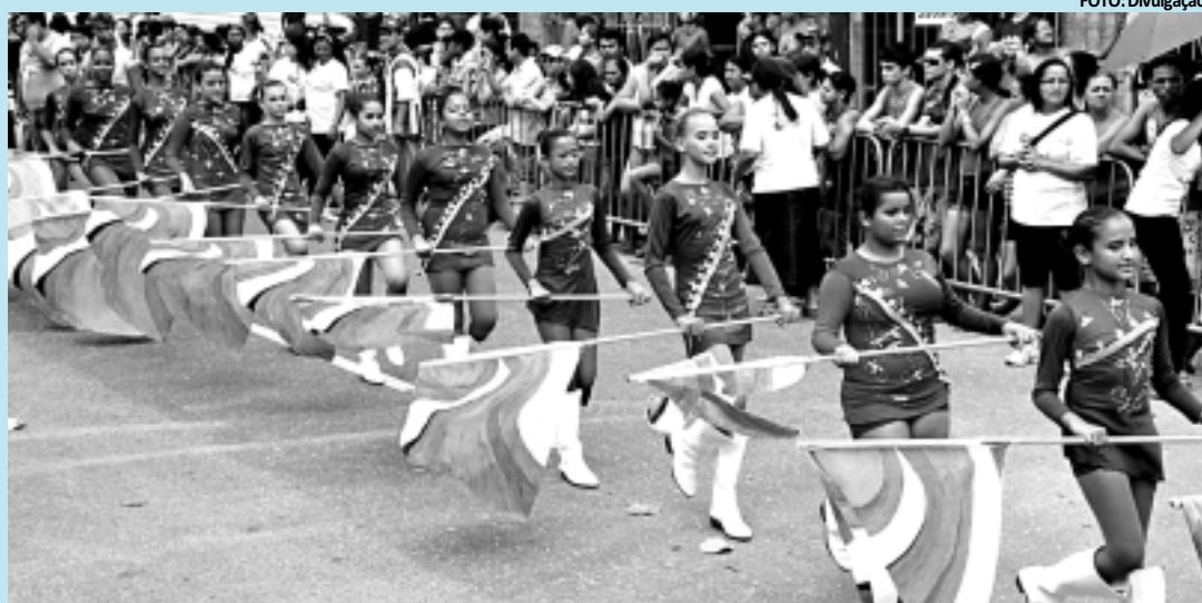
Estudantes de escolas municipais desfilaram ontem pelas ruas do Cristo Redentor e do Rangel

No Desfile Cívico dos Polos vão se apresentar 75 bandas marciais da rede municipal, que são formadas por alunos do 1º e 2º ano do Ensino Fundamental e Centros de Referência em Educação Infantil (Creis). "O desfile é uma re-