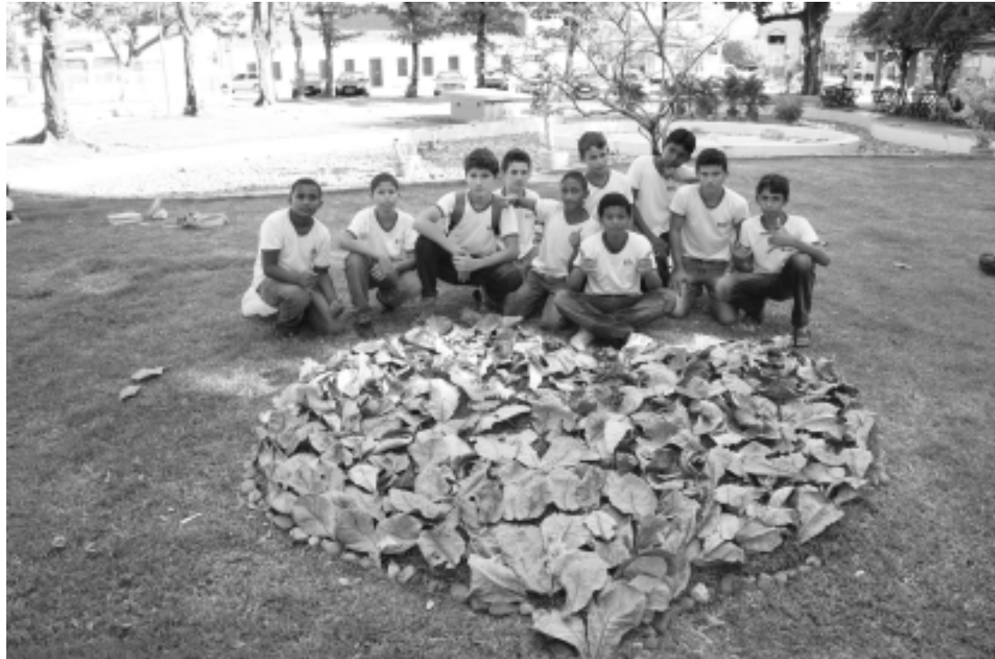
Grupo de jovens estudantes que participam de oficina de artes visuais inseridas no Projeto Olhares Sobre Sousa

Olhares sobre Sousa faz parte do Agosto da Arte e encerra atividades nesta semana