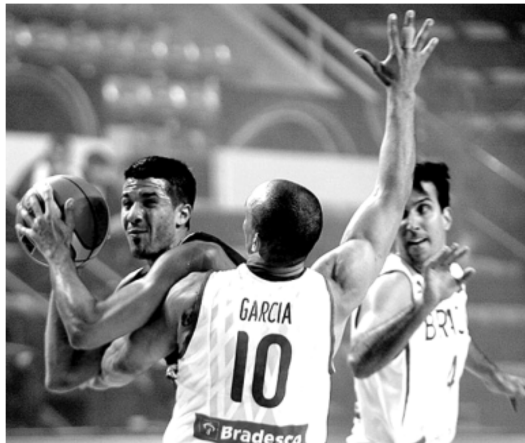
O Brasil teve um jogo difícil contra a Venezuela, e só conseguiu passar à frente no placar no final da partida

O Brasil volta à quadra hoje, às 20h30m, para enfrentar o Canadá. Quatro das cinco seleções de cada chave avançam à segunda fase, também disputada em grupos. A chave brasileira tem ainda a República Dominicana e Cuba.