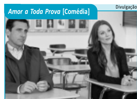
Amor a Toda Prova [Comédia]

MEIA NOITE EM PARIS (Midnight in Paris, EUA/ França, 2011). Gênero: Comédia. Duração: 100 min. Classificação: 12 anos. Legendado. Direção: Woody Allen, com Kurt Fuller, Owen Wilson, Marion Cotillard, Michael Sheen, Tom Hiddleston. Gil vai a Paris com a noiva, Inez, e os pais dela, John e Helen. Estar em Paris faz com que Gil volte a se questionar sobre os rumos de sua vida, desencadeando o velho sonho de se tornar um escritor reconhecido. CinEspaceo 2: 16h10 e 20h50.