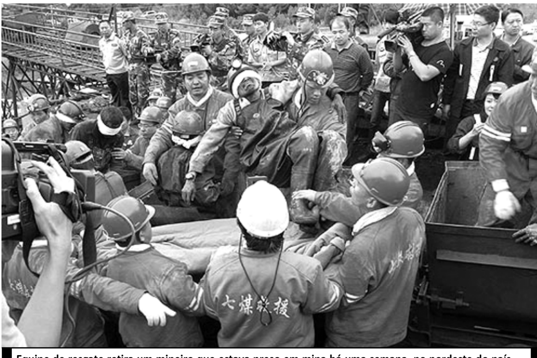
Equipe de resgate retira um mineiro que estava preso em mina há uma semana, no nordeste do país

A mina onde ficaram presos havia sido fechada em 2007, mas reabriu clandestinamente no dia 16 de agosto deste ano. Sete oficiais foram detidos por causa das operações no local e o líder do condado de Boli, onde ela se localiza, e seu vice foram demitidos.