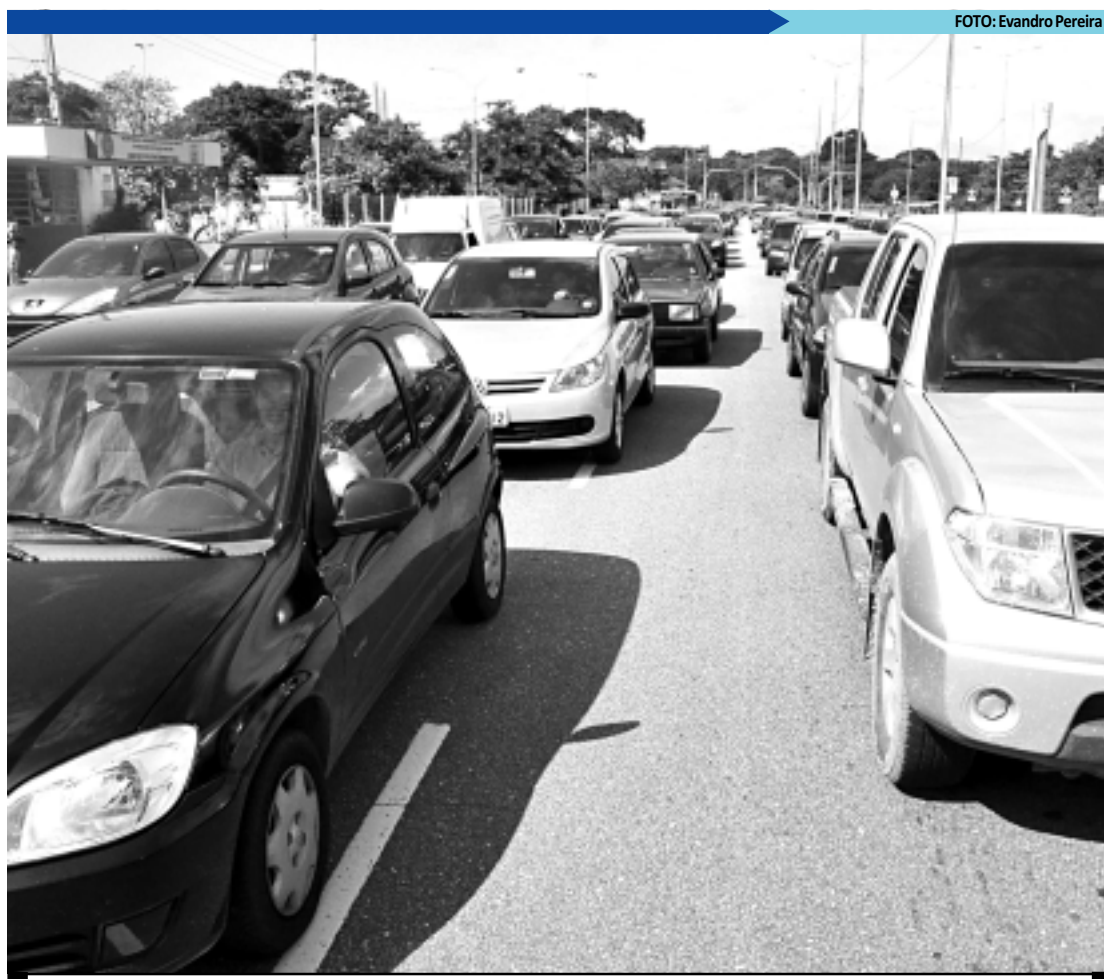
Com a mobilização dos servidores, um congestionamento se formou em frente à UFPB das 6h às 10h da manhã