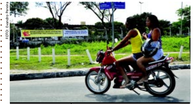
[FOTO&LEGENDA] A cena, infelizmente, não é rara. Enquanto condutora e passageira trafegam em uma motocicleta cinquente com capacete no braço, centenas de vítimas chegam todos os meses aos hospitais da Capital vítimas de trauma pela falta do uso do equipamento.