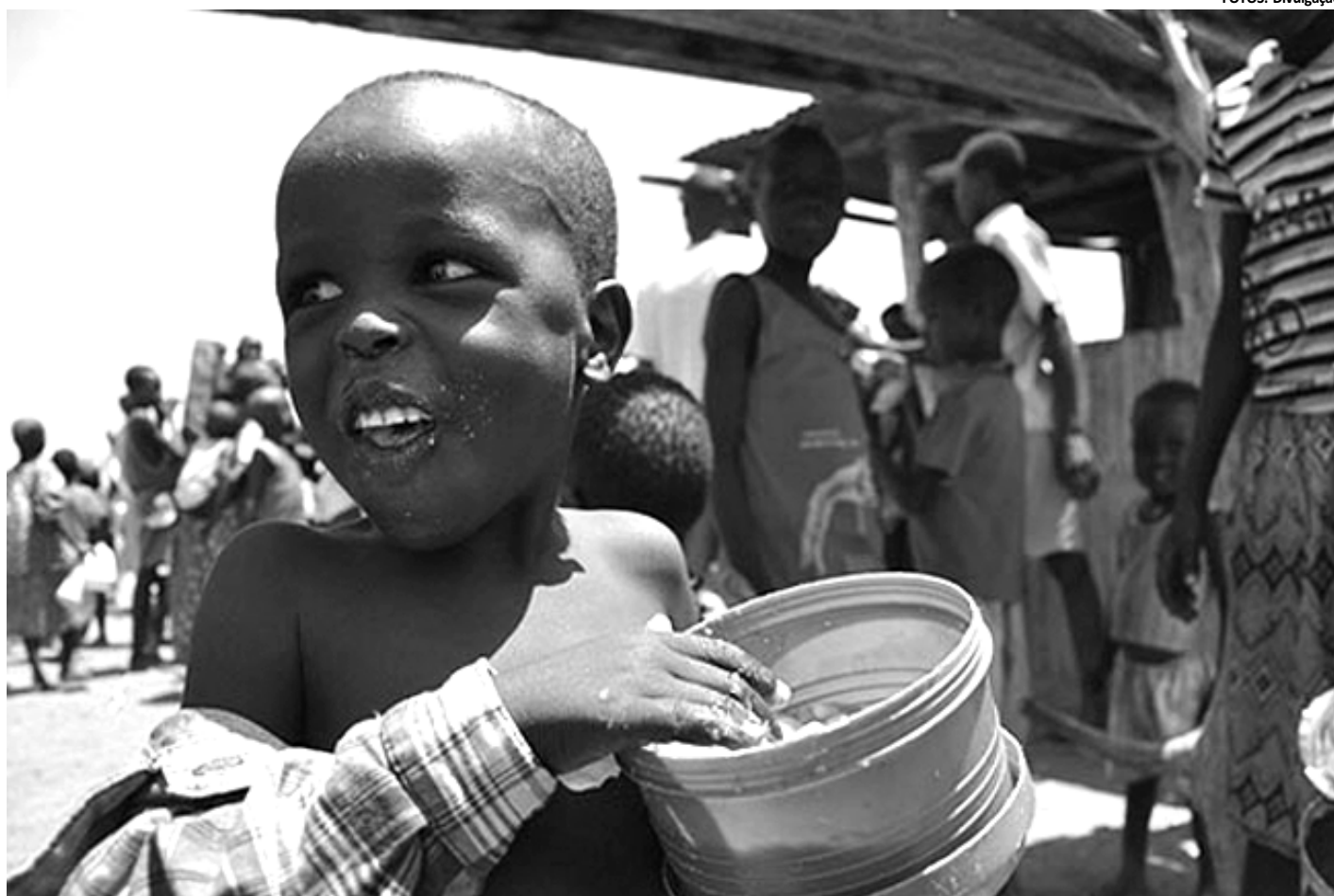
Criança refugiada segura recipiente com comida que recebeu em centro de alimentação no Quênia, onde a fome é o maior problema