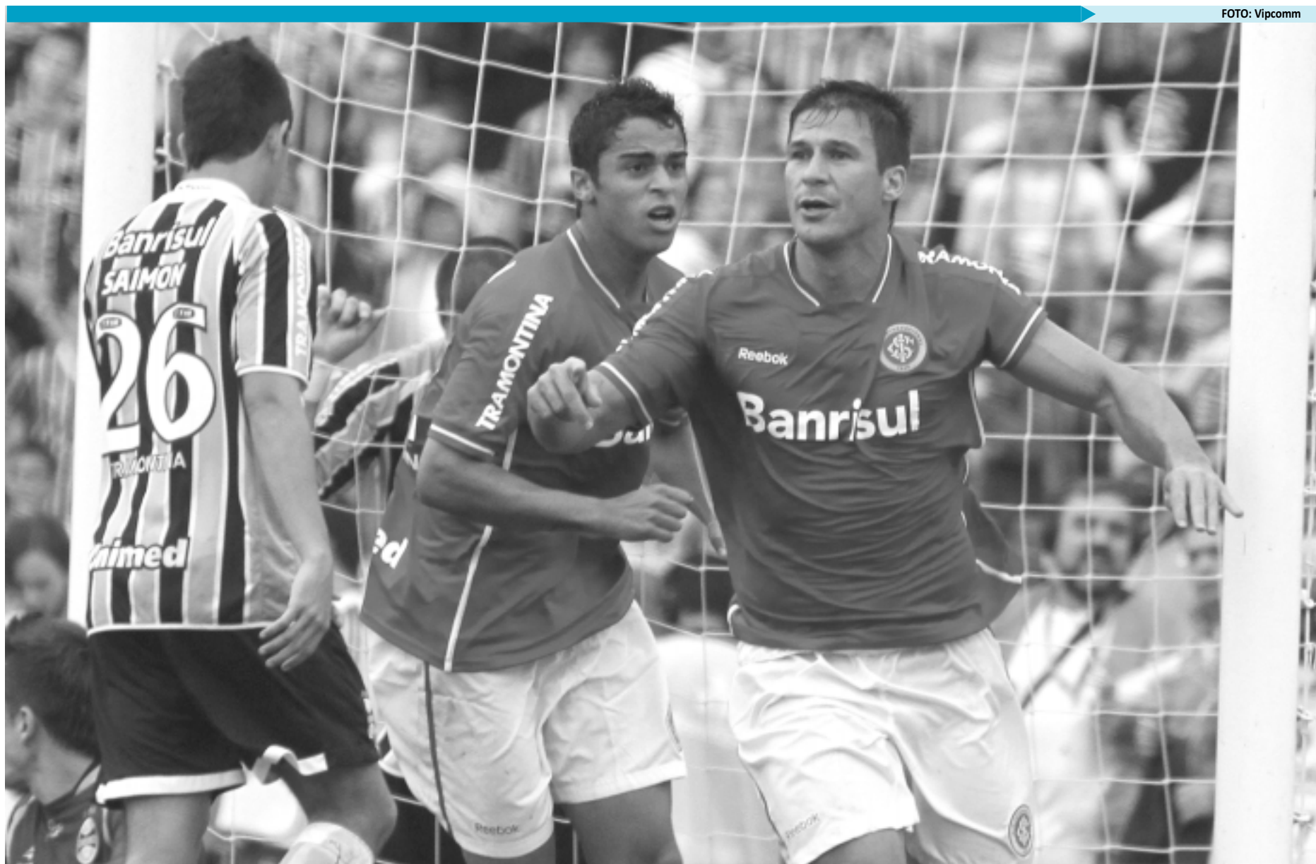
O Internacional, depois de perder para o Grêmio, busca a reabilitação e já foca a zona de classificação para a Libertadores. O time do zagueiro Índio enfrenta o Santos, no Estádio do Beira-Rio

O maior problema será a escalação contra o Botafogo. Além dos lesionados, Muricy não poderá contar com o atacante Neymar, o meia Paulo Henrique Ganso e o volante Danilo, que estarão servindo a Seleção Brasileira em amistoso contra Gana, em Londres.