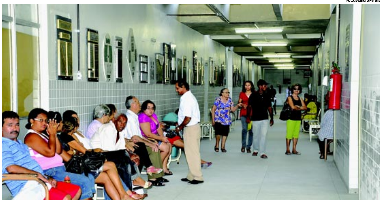
NA CAPITAL Greve do HU deixa 2 mil pessoas por dia sem atendimento a partir de segunda PÁGINA 11

o mudança na diretoria da unidade e o retorno de oito detentos que foram transferidos para um presídio em Rondônia. O movimento chegou ao fim de forma pacífica. PÁGINA 22