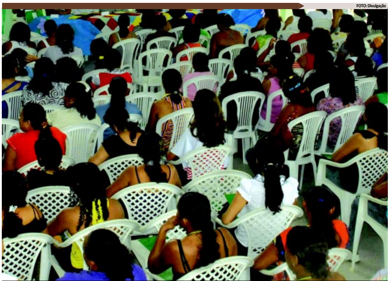
De janeiro a julho deste ano, 37 foram mortas no Estado, conforme dados do Centro da Mulher 8 de Março. A marca pode ser considerada maior