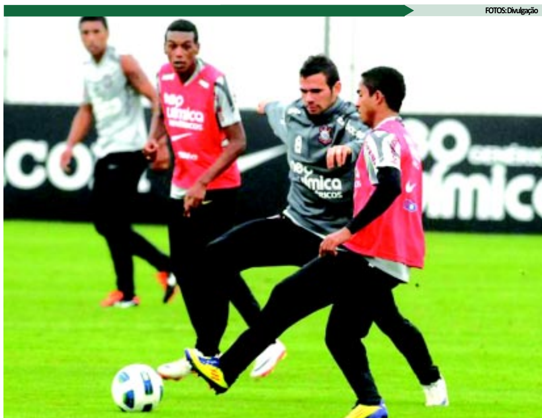
Timão pretende esquecer a derrota para o Palmeiras e começar o retorno com uma grande vitória hoje

"A gordura estava boa e secou. Mas vale lembrar que o Flamengo tem um grupo forte, que o São Paulo está buscando, o Vasco está chegando. Perdemos para gran-