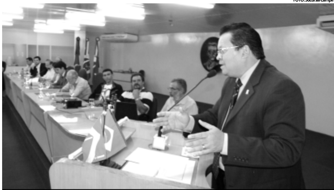
Vereadores promoveram audiência com a participação dos gestores de trânsito no município de Campina Grande