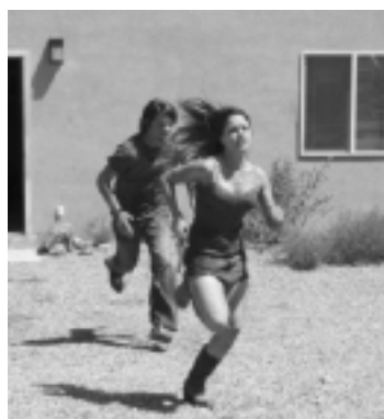
A Morte Pede Carona, na Record