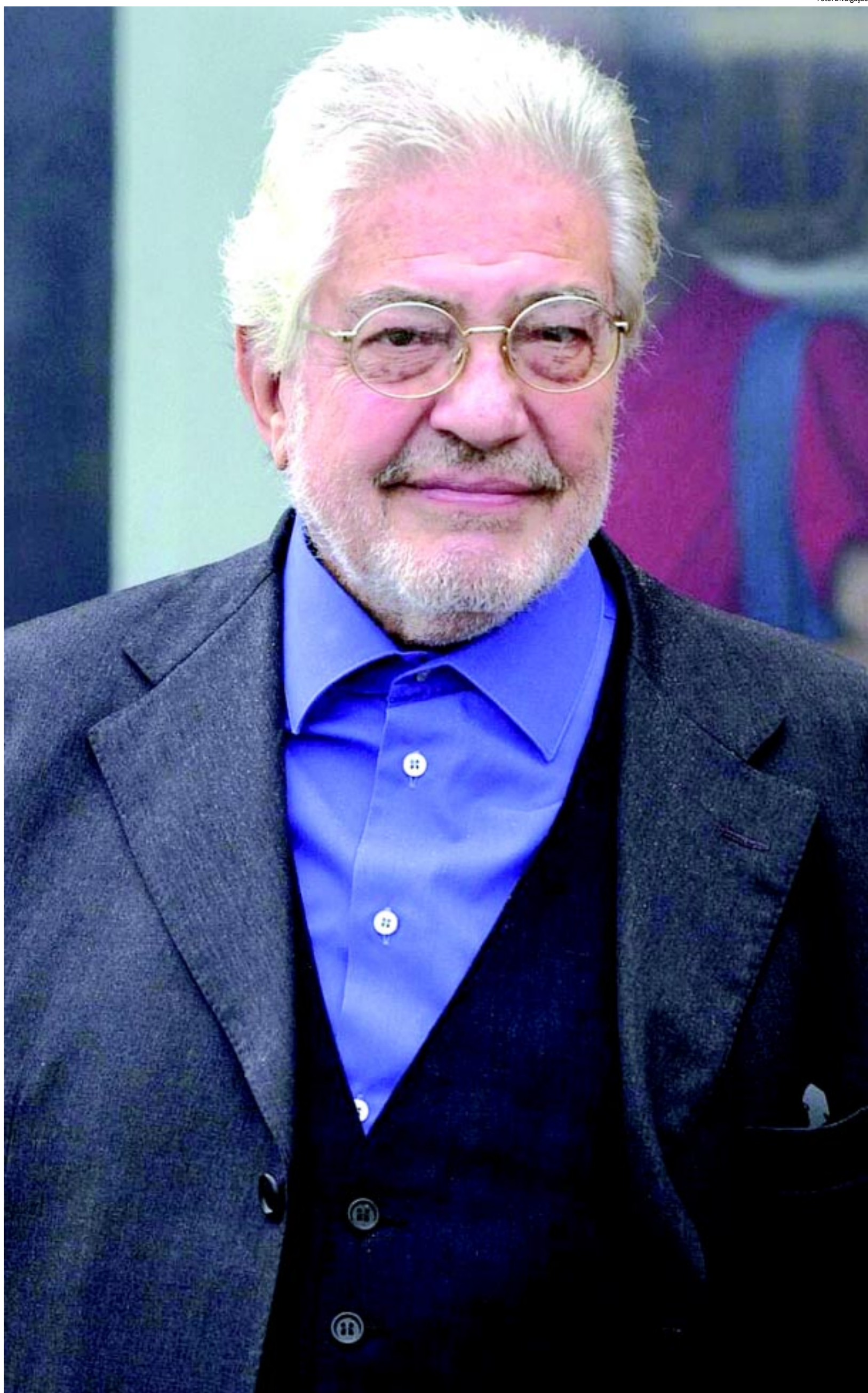
Diretor de "clássicos" como A Viagem do Capitão Tornado , Scola disse que fazer cinema hoje requer uma energia e um tipo de contato que ele não tem mais